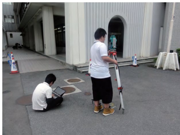
図5 測量地点で直接データ入力を行う様子