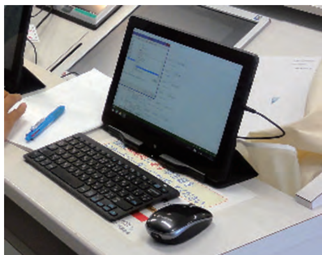
図6 本年度導入したタブレット PC