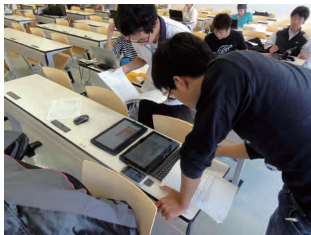
図7 班の中でデータ処理を比べる様子

図7は、班の中でデータ処理を比べる様子である。班が同じなら測量データは同じであるが、データ処理の各プロセス毎の有効数字の考え方等の違いで、各班員の結果は厳密に同じにならない。途中での作業でタブレット PC をノートのように使って比べあうことも簡単になり、学生同士共助共学の促進に効果的であった。またデータ処理の途中で教員への質問の回数も増えた。(図8参照)