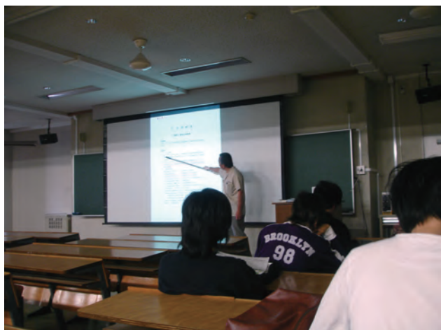
図4 平成22年度までの閉合トラバースの計算の指導

前述の様に、班単位で角測量・水準測量・距離測量の3種の測量が終わってから閉合トラバースの計算を行うわけであるが、この計算に取り掛かるタイミングは各班でほぼ揃っているため、班単位で講義室に戻り測量データから計算する。計算方法は本来は1年次後期の「測量学」で学んでいるはずであるが、教科書1)に沿って改めて解説し、教員とTAが班単位で座って計算している学生達の間を回り、その計算状況の進行状態や測量結果の計算の精度等を確認する。(図4参照)