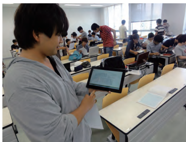
図8 教員への質問をタブレット PCで行う様子