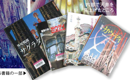
図書館にあるガウディに関する書籍の一部▶