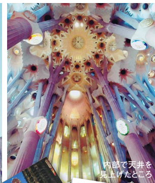
内部で天井を見上げたところ