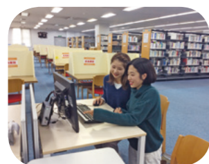
ホームページから

本以外にもDVDも希望を出せるので図書・視聴覚に見たいものがない場合は、希望を出してみてもいいですか？